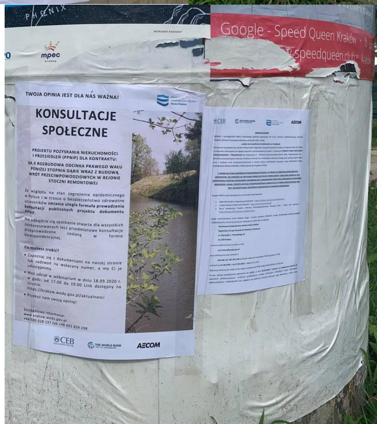
Photos 7- 11 Exemplary announcements on the public consultations and information posters for the Draft LA&RAP placed on information boards at performance sites (more photos available in archives of the Consultant and PGW WP RZGW in Cracow).