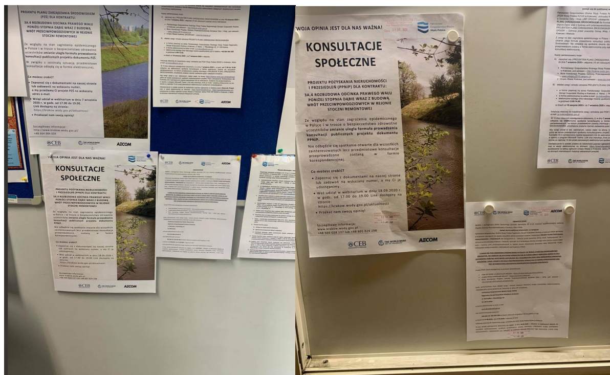
Figure 5, 6. Announcement on the public consultations for the Draft LA&RAP published in the local press ( Gazeta Krakowska ).